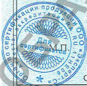
Схема сертификации: Ic